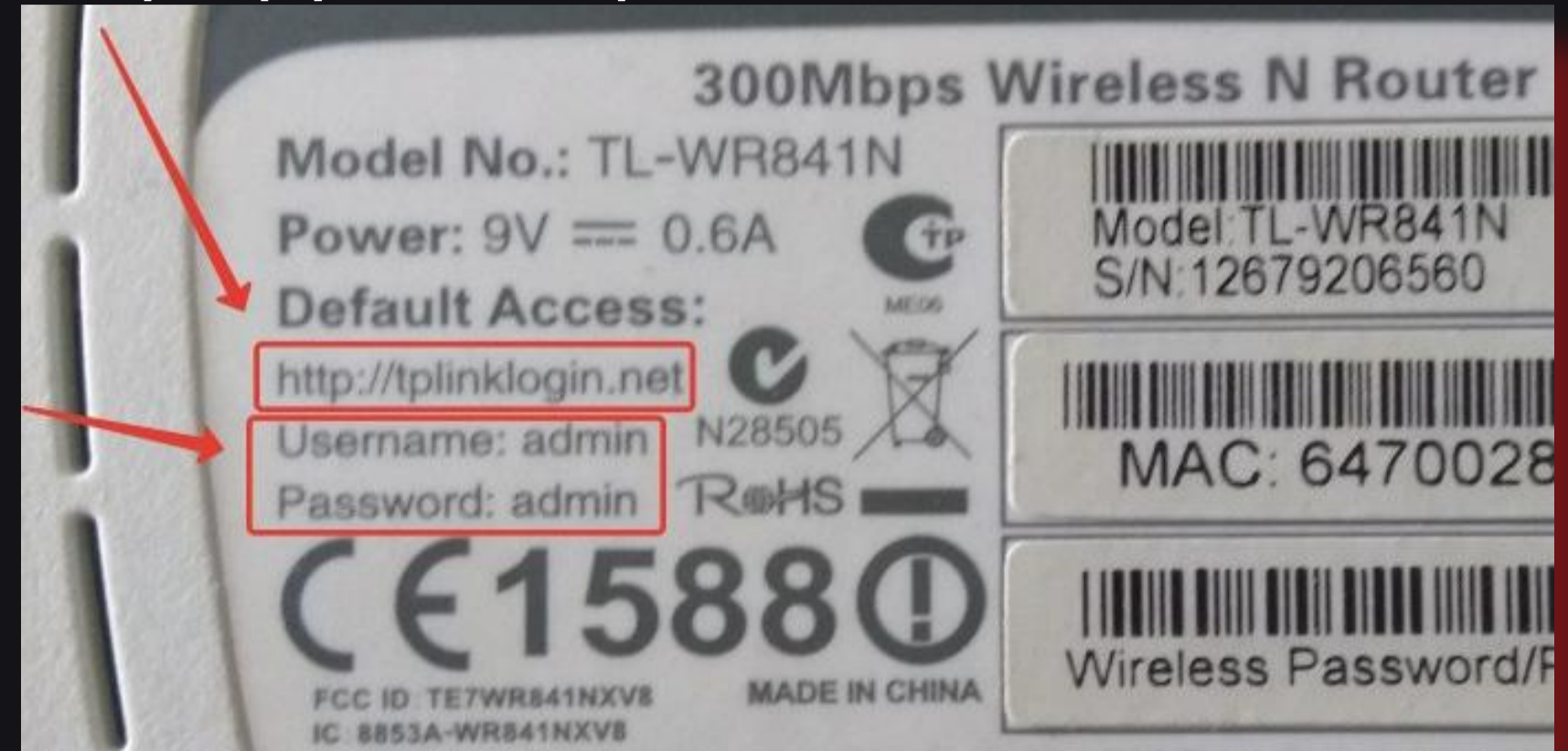
(Зображення наведені для прикладу)