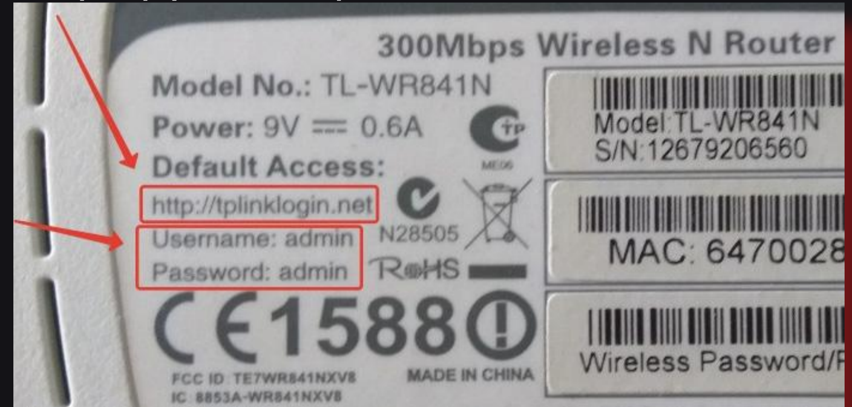
(Зображення наведені для прикладу)